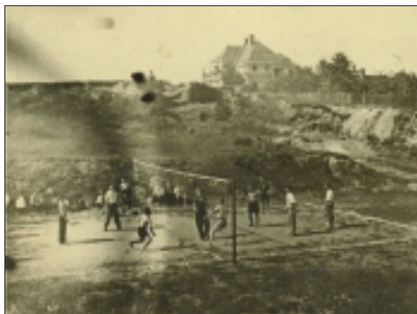
Volejbalový turnaj Jičín - S. Lazce hřiště 1946