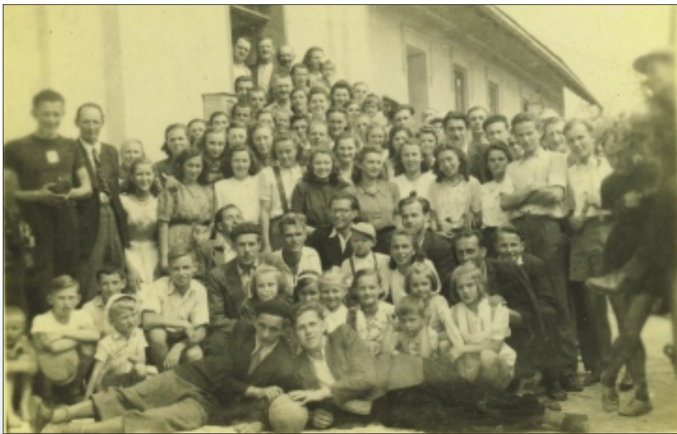
Návštěva kmotrů z Agrostroje Jičín v roce 1946 před hostincem Bílý Anděl v Suchých Lazcích.