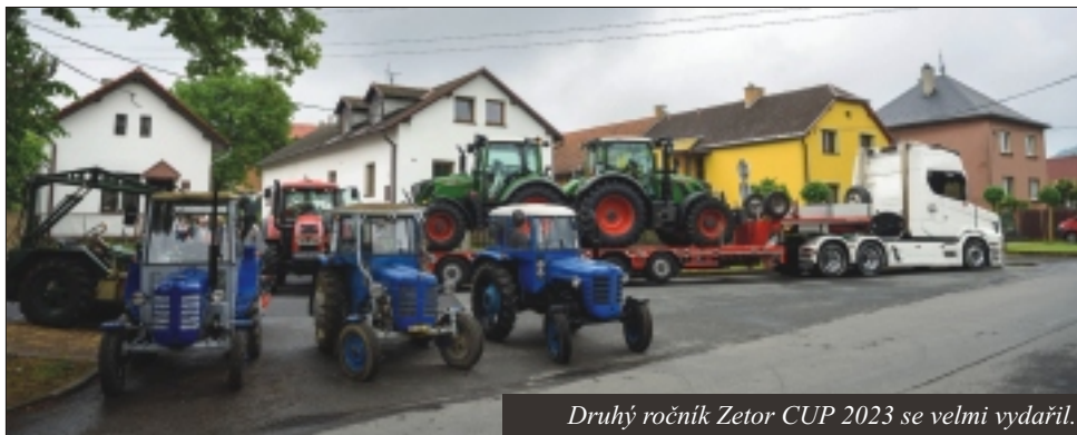
Druhý ročník Zetor CUP 2023 se velmi vydařil.