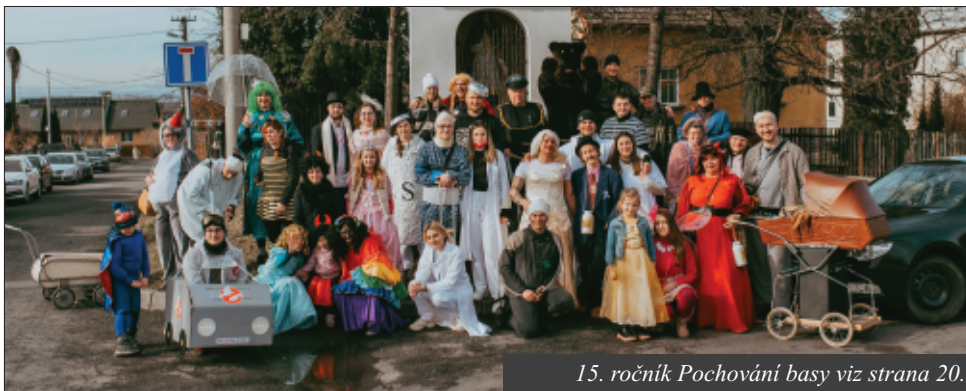
15. ročník Pochování basy viz strana 20.