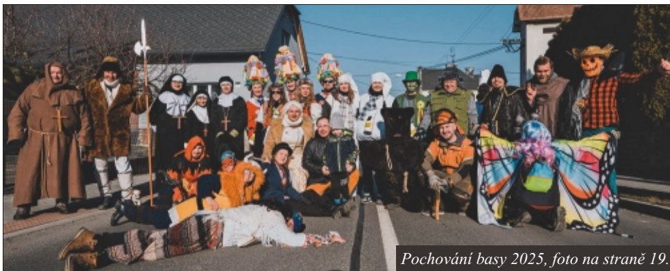
Pochování basy 2025, foto na straně 19.