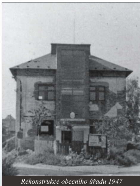
Rekonstrukce obecního úřadu 1947